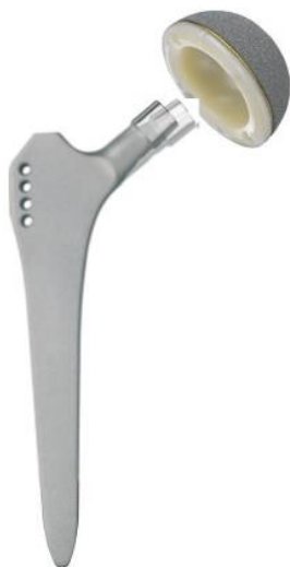
Fig.2: femur- & acetabulumcomponent (kopje niet afgebeeld)

In het algemeen bestaat de prothese uit metaal (titanium, cobalt-chroom), kunststof (polyethyleen) en/of keramiek dat speciaal voor medische toepassingen is ontwikkeld. Een heupprothese bestaat uit een deel dat in het bovenbeen wordt geplaatst ("femurcomponent"/steel), een deel dat in de heupkom wordt geplaatst ("acetabulumcomponent"/kom) en een bolletje ("kopje") dat op de femurcomponent wordt geplaatst en het nieuwe gewricht vormt met de acetabulumcomponent. De femurcomponent van de door ons gebruikte heupprothese is een Zweymuller type steel. De Zweymuller heupprothese heeft een revisiepercentage van minder dan 5% na 20 jaar. De acetabulumcomponent van de door ons gebruikte heupprothese is de RM Pressfit Cup. Deze cup heeft een revisiepercentage van 17% na 20 jaar. Indien noodzakelijk is reviseren van de heupprothese in het algemeen goed uitvoerbaar.