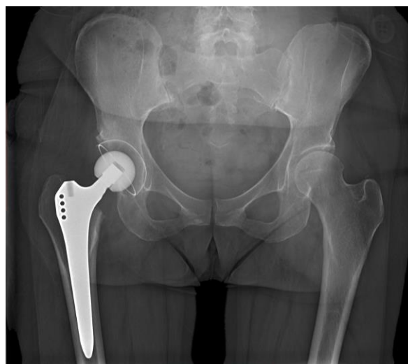
Fig.3: Röntgenfoto na geplaatste totale heupprothese