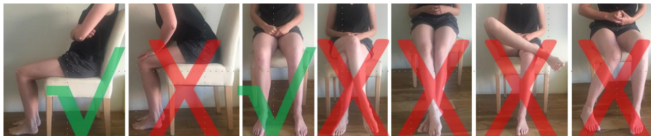
Fig.4: Leefregels gedurende de eerste 6 weken na totale heupprothese