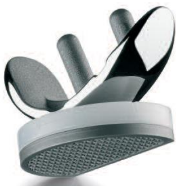
Fig. 2: unicondylaire knieprothese

De prothese bestaat uit metaal (titanium en cobalt-chroom), en kunststof (polyethyleen) dat speciaal voor medische toepassingen is ontwikkeld. De door ons gebruikte halve knieprothese heeft een revisiepercentages van 5-8% na 6-13 jaar. Indien noodzakelijk is reviseren van de halve knieprothese naar een totale knieprothese in het algemeen goed uitvoerbaar.