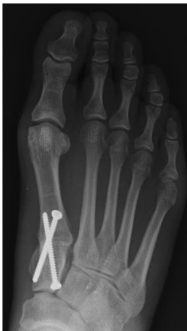
Fig.3B: voet na operatie