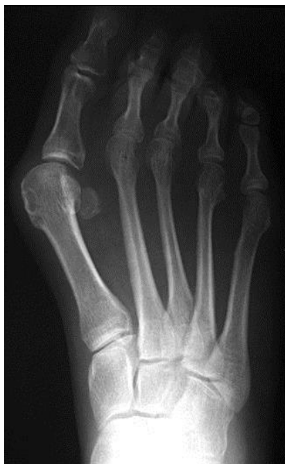
Fig.3A: hallux valgus voor correctie