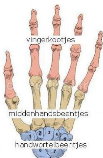
Fig.1: botten van de hand

Alle gewrichten van de pols en hand worden omsloten door het gewrichtskapsel. De binnenbekleding van het kapsel produceert gewrichtsvocht. Dit vocht zorgt voor voeding en smering van de kraakbeenlaag van het gewricht.